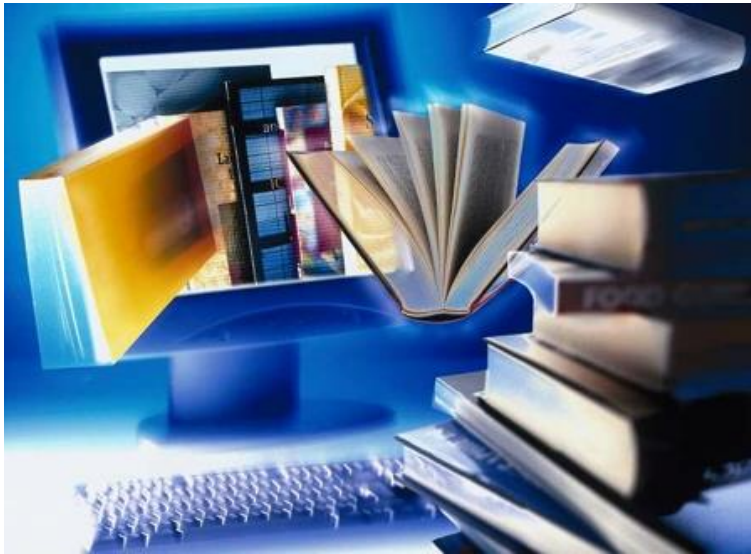
Ilustração 1: A revolução da Internet.