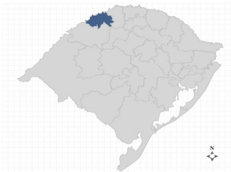
Figura 1 – Mapa das regiões do Estado do Rio Grande do Sul

Na Figura 1, observar-se a divisão das regiões do Estado do Rio Grande do Sul, com destaque para a Região Fronteira Noroeste.