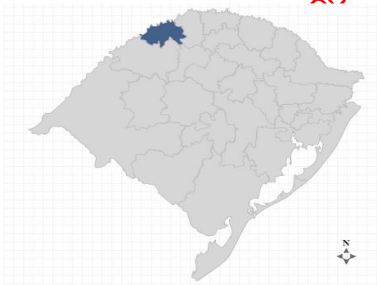
Figura 1 – Mapa das regiões do Estado do Rio Grande do Sul

Na Figura 1, pode-se observar a divisão das regiões do Estado do Rio Grande do Sul, sendo que a Região Fronteira Noroeste Rio-grandense está em destaque.