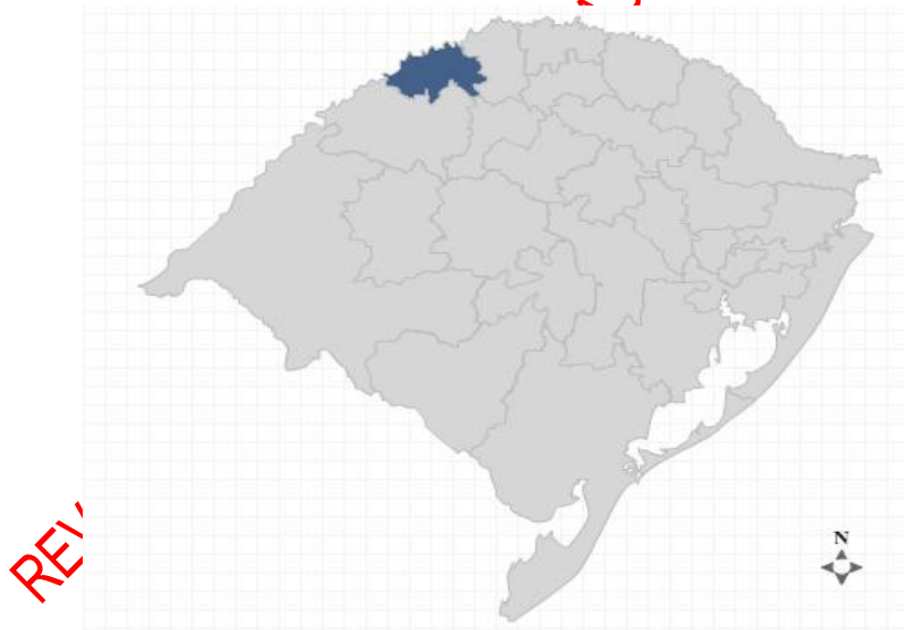
Figura 1 – Mapa das regiões do Estado do Rio Grande do Sul