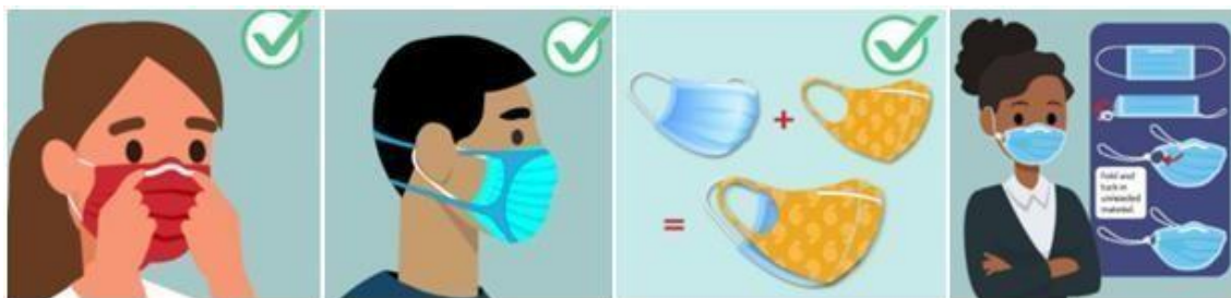
Figura 1: Como utilizar máscaras descartáveis ou de tecido de forma a potencializar sua proteção

IMPORTANTE! A sala de lanche, refeitório ou ambientes compartilhados, em especial onde são realizadas as refeições ou consumo de líquidos, são espaços e atitudes de maior risco de contaminação para COVID-19 e de demais vírus respiratórios.