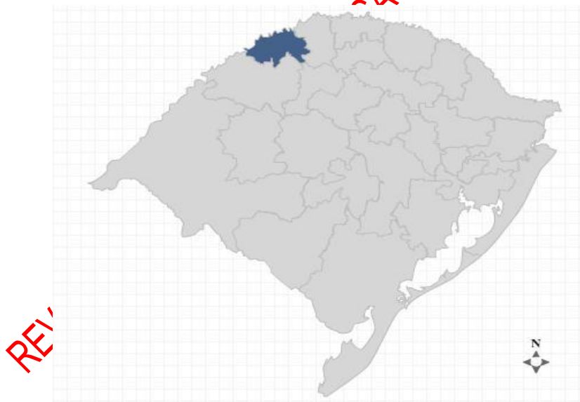
Figura 1 – Mapa das regiões do Estado do Rio Grande do Sul